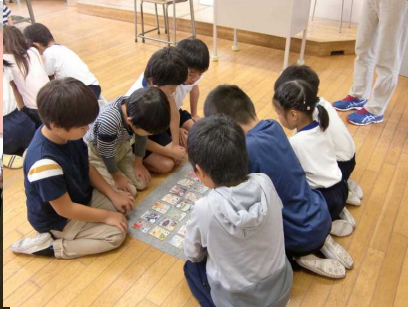
総社カルタで地域を知る