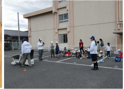
地元企業の方から学ぶ