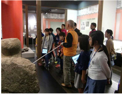
里山学校で地域を知る

協力していただく皆様に感謝するとともに、将来地域の一員として社会を担う子どもたちでするので、1つ1つの経験や学んだことを大切にさせたいと思っています。