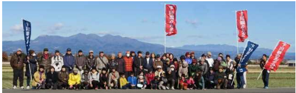
力丸町から赤城山を望む

12月8日(日)「第9回カルタウォーク」に参加しました。自治会長さんや地域の皆さんと端気川用水、四体さま、善昌寺、力丸城跡、飯玉神社、