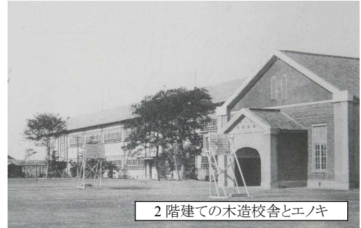
2階建ての木造校舎とエノキ

大えのきの樹齢は100年を超えています。昭和8年(85年前)に完成した2階建て校舎のすぐ前に、校舎の高さくらいのエノキが見えます。当時は木造校舎の玄関前に立っていましたが、新校舎が北側に建て替えられ、現在のように校庭の真ん中になりました。エノキは、4月に緑色の花を咲かせ、6月に緑色の果実ができます。9月になると果実は赤く熟します。