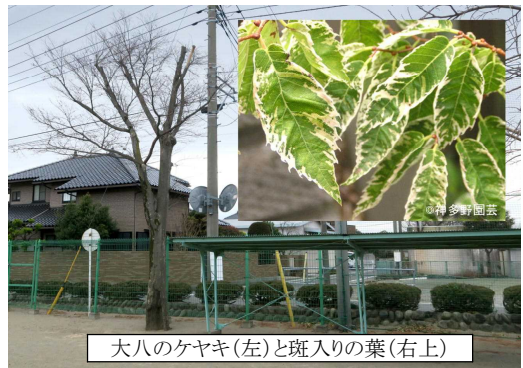
大八のケヤキ(左)と斑入りの葉(右上)

校庭の駐輪場の近くに植えられているケヤキは、右の写真のように葉に白い斑が入る珍しい種類です。大正8年に下小を卒業した人たちが80歳になったお祝いに植えました。「自分たちの後輩である下小の子供たちがケヤキのように、素直に、のびのびと、たくましく育ってほしい。そして、よく学び立派な人になれるように」という願いを込めて昭和62年(32年前)に植えられました。