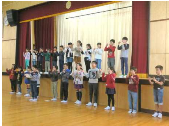
4年生は、らっこの会の皆さんに手話を教えていただきました。人権集会では、全校の児童に手話を紹介しました。