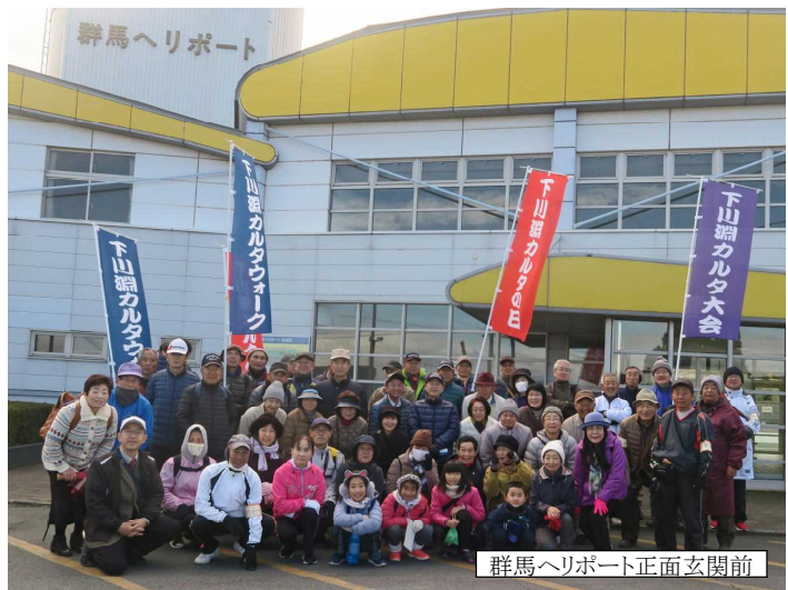
群馬ヘリポート正面玄関前

「第8回カルタウォーク」に参加しました。自治会長さんや地域の皆さんと群馬ヘリポート、樋の滝、善光寺、英霊殿、下川淵小など11スポット約7kmを散策しました。群馬ヘリポートでは、献花台に手を合わせて防災ヘリコプター墜落事故で亡くなった方々のご冥福をお祈りしました。ヘリコプター学習館では、展示用のヘリコプターに乗り操作体験をしました。下川淵小ではエノキの樹齢について説明させていただきました。本校のエノキは、誰