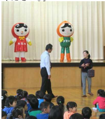
人KEN まもる君、人KEN あゆみちゃんといっしょに人権の勉強をしました。