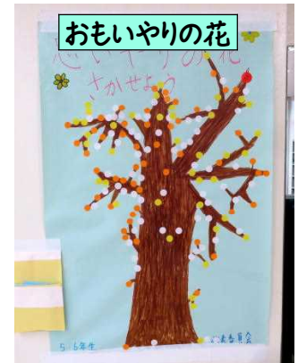
友達に親切にした人、親切にもらった人はシールを貼りました。