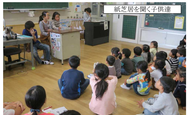
紙芝居を聞く子供達

来年度入学予定の子供達が健康診断に来てくれました。この健康診断は、6名の校医さんと職員、そして6年生の児童全員が協力して実施しています。午前中は職員と6年生で会場準備、1～5年生は給食なしで11:30に下校。6年生はお弁当を食べ12:30から受付を開始し、いろいろな検査や検診のお手伝いをしました。誘導担当の児童は就学児童を一行に並ばせて各検査会場へ連れていきます。検査が終わると待ち時間の合間に紙芝居を読んであげます。