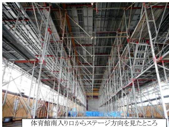
体育館南入り口からステージ方向を見たところ

2016年の熊本地震では、体育館の天井が落下するケースがありました。下小の体育館は天井が落下しにくい構造でしたが更なる安全のために天井板を撤去しました。右の写真のように体育館全面に足場を組んで天井板をはずしウレタンフォームという断熱材を吹き付けました。さらに、全面にネットを張ってあります。体育館で地震が発生したときは、窓から離れて体育館の中央に集まり姿勢を低くしてください。ところで、群馬県は関東甲信越の中では最も地震の少ない県ですが、いくつかの断層があります。南には埼玉県との境に深谷断層帯があり、北東には赤城山のふもとから桐生市にかけて伸びている大久保断層帯と太田市の太田断層帯があります。これらの断層が動くとき直下型の地震が発生します。大きな地震が起きても校舎や体育館は倒壊しないので、学校にいるときはすぐに机の下などにもぐってください。