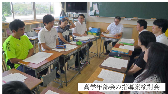
高学年部会の指導案検討会

子供たちは、夏休みならではの体験ができたでしょうか。私たちは、水泳指導が終わった後、2学期の授業や学年行事、運動会の準備をしました。それから、夏休み中もたくさん勉強をしました。今年の11月9日(金)に4年生と6年生で研究授業を行う準備として市教育委員会の指導主事の先生や外国語主任会の先生方と一緒に英語の授業の進め方を研究しました。本校で目指しているのは「外国語を用いて進んでコミュニケーションを図ろうとする児童の育成 ～相手意識をもって楽しく取り組むことができる授業づくり」です。子供たちが英語を楽しく聞いたり話したりする活動を通して、自分の思いを相手に伝える喜びを実感できるようにしたいと思います。また、「読むこと」「書くこと」については英語に慣れ親しみながら無理なく習得できるようにしたいと思います。学校でどんな勉強をしているのかお子さんに聞いてみてください。