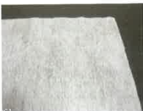
(マスク、簡易お手拭、 包装紙など)