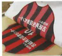
(アイロンプリント紙)