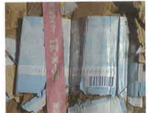
(石鹸や柔軟剤の包装箱)