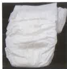
(紙おむつ、生理用品、 ベット用トイレシート)