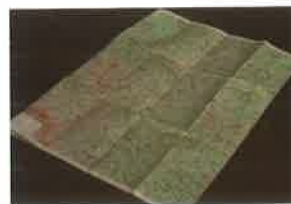
(地図、選挙ポスター)