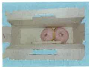
(ピザ、ケーキなどの食品を直接包装した容器)