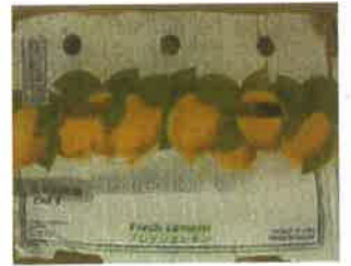
(輸入青果物・水産加工品を入れる段ボール箱)