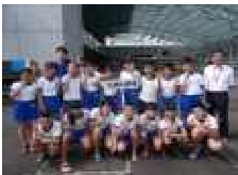
やり切ったよい表情です