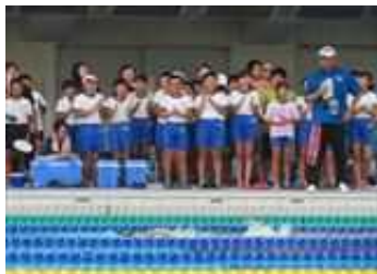
応援もがんばりました

県大会には、6年生男子が「100mバタフライ」に出場しました。本校からは一人の出場でしたが、学校の代表として、力強い泳ぎを見せてくれました。