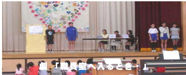
劇「職員室へ入るとき」

5月20日、「なかよし集会」を行いました。本校では、年2回の人権集中学習を行い、偏見や差別、いじめのない学級づくりに取り組んでいます。「なかよし集会」は、学級で決めた「なかよし宣言」(子どもの人権宣言)を発表し合う児童集会です。はじめに児童会本部の児童が、今年度の児童会スローガン「言葉のたこやき」の発表と劇「職員室へ入るとき」を行いました。子どもたちは真剣に見入っていました。その後、各学級の代表児童が「なかよし宣言」を発表しました。