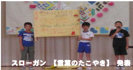
スローガン【言葉のたこやき】発表

今年の児童会スローガン 「言葉のたこやき」 た たすけてもらったら ありがとう こ ことばの最後に です。ます。つけよう や やめよう 悪口を言っちゃダメ き きをつけよう いろんな人への言葉づかい