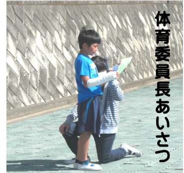
体育委員長あいさつ

児童を代表して、児童会体育委員会の委員長が、「小学校最後のプール」と題し、プール学習の目標を次のように述べました。