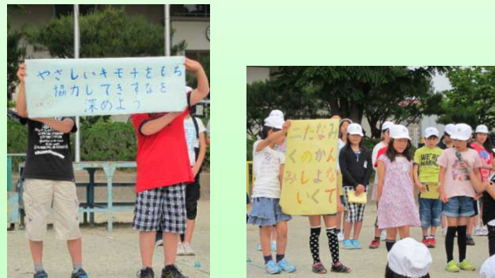
学級のスローガン

学級ごとに、スローガンを作成し、1回目のなかよし集会で発表したり、みんなで取り組んだりしています。 2回目のなかよし集会では、1年間の取り組みをクラスごとに発表し合っています。