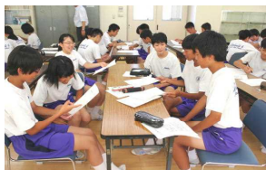
<参加者の話し合い>