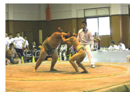
<成田市中台運動公園相撲場にて>