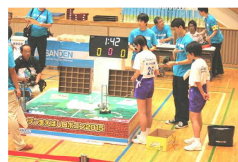
<前橋市総合福祉会館にて>

ロボットを操作し、ボールを指定の枠に運んで入れるという競技でした。2回戦まで進み惜しくもそこで敗退しましたが、楽しく競技に取り組むことができました。