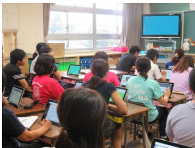
使い方の研修をしている先生方

タブレットPCや実物投影機を有効活用して、わかりやすい授業づくりに努めていきたいと思っています。